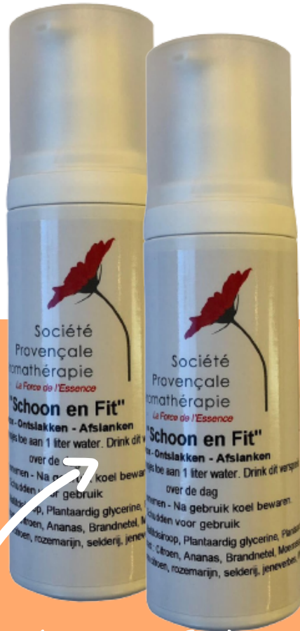
Detoxkuur Schoon & Fit