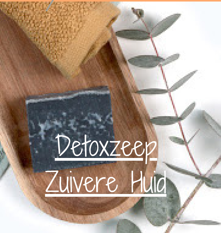
Detoxzeep Zuivere Huid