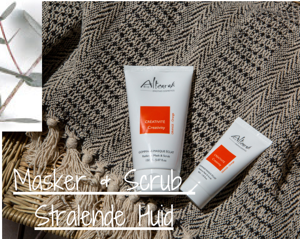
Masker & Scrub Stralende Huid